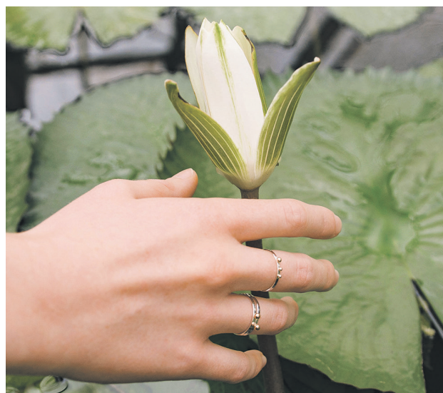
MOMENTÁLNE obľúbená kolekcia autorky pripomína drobné zlaté kvapky rosy, ktoré však nepristáli na listoch či trávach.