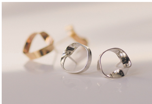
NÁUŠNICE z kolekcie Stuchy z recyklovaného zlata a striebra. Každý kus je originál.