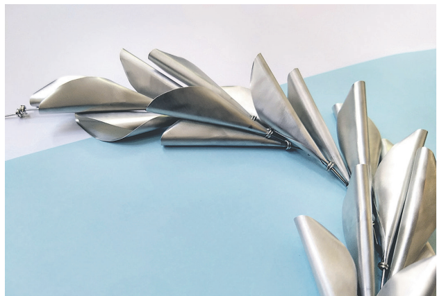
KOLEKCIA Alu Petals premenila plechovky do podoby jemných hliníkových lístkov.